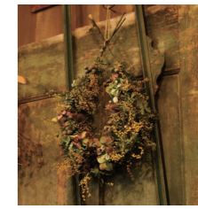
(中) ドライフラワーのリースは、自然光が届きにくい玄関などにも飾れますよ (epanouir)