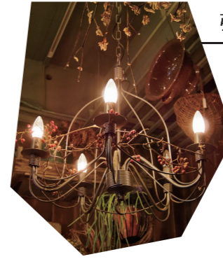
(左) サンキライの実を照明にからませてアンティークな雰囲気 (epanouir)