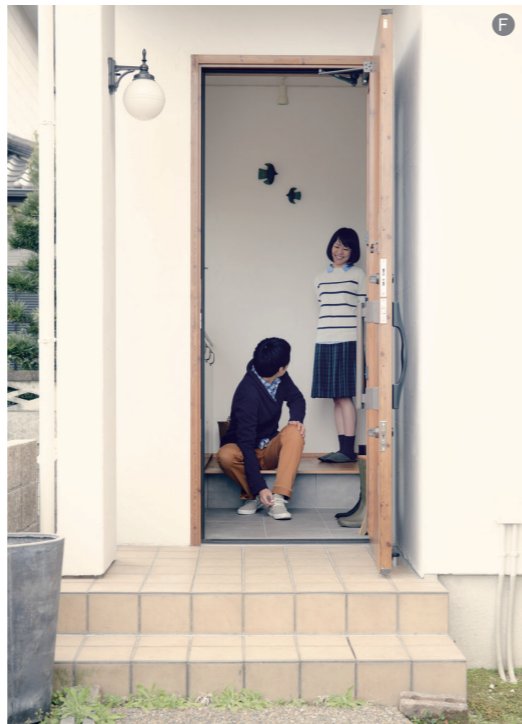
F:玄関まわりの外壁にも真っ白な漆喰を塗って、さわやかな印象に仕上げました。