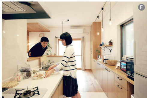
D:壁面につくりつけた大容量の収納で、キッチンまわりは常にすっきり。E:キッチンの腰壁は天板の幅を広くとった配膳にも便利なデザイン。M様曰く、ちょうどもたれかかりやすい高さなので、写真のようにキッチンにいる奥様との会話も弾むそう。