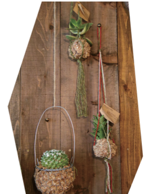
③ 吊し苔玉 (多肉植物)