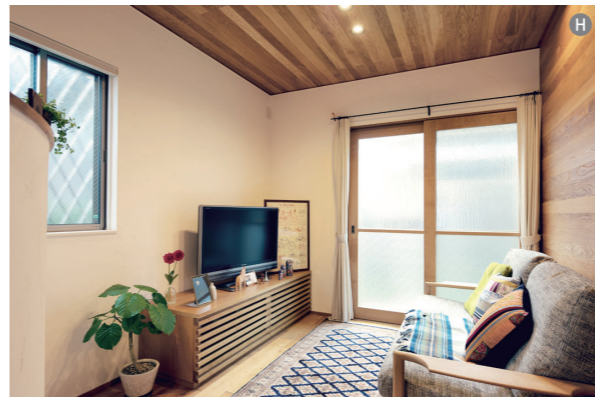
G:構造上抜けない壁を利用したリビングとダイニングの配置。開放感がありながらも、それぞれが独立して落ち着く場所になりました。 H:リビングのテレビボードも空間に合わせてオリジナルで製作。床や壁と樹種や色味を合わせられるので、統一感のある仕上がりになります。