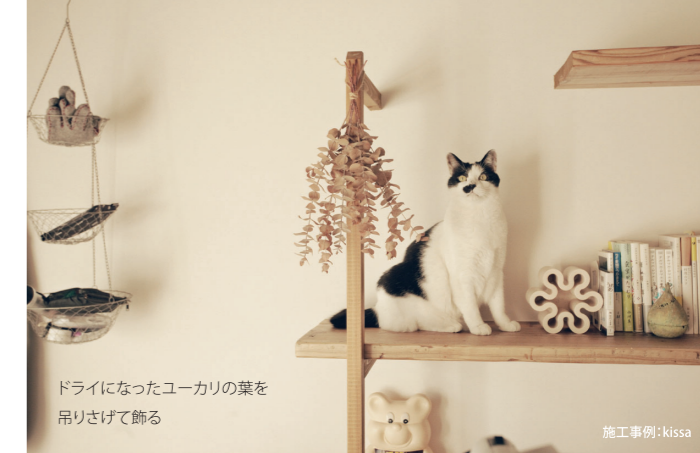
ドライになったユーカリの葉を 吊り上げて飾る