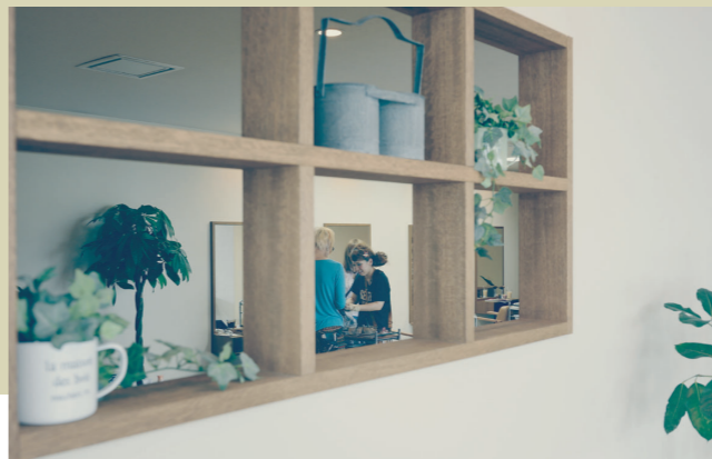
ゆったりとくつろげる店内。さりげなく飾られた雑貨やグリーンにも、オーナー様のセンスが光ります。

すぐ近くで経営されていた店舗の拡大移転に伴い、新しいお店づくりのお手伝いをさせて頂きました。地域に根付き、長く愛される美容院となるように、空間はシンプルで素朴に。色や素材の使い方にも気を使い、どこかほっとする雰囲気空間に仕上げました。小さなお子様連れのお客様でも安心して来られるようにファミリールームを設けるなど、隅々まで心配りの行き届いたサービス。髪を切ると同時にホットでできる時間も提供してくれる、そんなお店が出来上がりました。