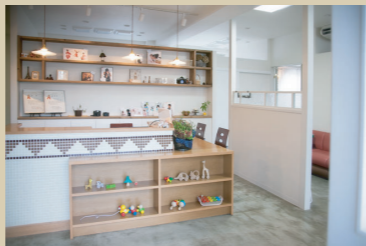
(写真上)4つのシーンで撮影できるスタジオ内。写真奥には、オリジナルでつくったホリゾン。 (写真下)木・タイル・コンクリートと素材を活かしたエントランス。