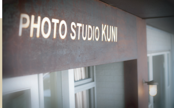
エントランス看板はコルテン銅という素材を使用し保護性錆を活かしたデザイン。

自然光が降り注ぐ明るいスタジオでの撮影は、特別な記念日の撮影から自然体な家族写真まで、多くの方に喜んでいただける背景になるでしょう。