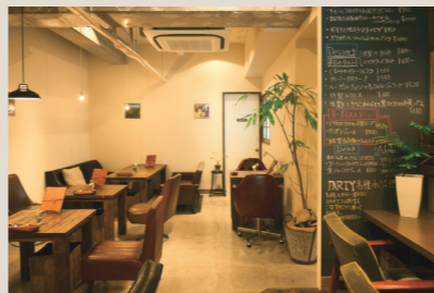
(写真左上)カリモク60のKチェアが並ぶカウンター一席。キッチンとの距離感が程よく、一人で来てもゆっくりと過ごせるお勤めの席です。 (写真左下)店内奥の席は段差をつけてモルタル仕上げの床に。手前側の無垢フローリングと雰囲気が変わり、色々な使い方が出来そう。