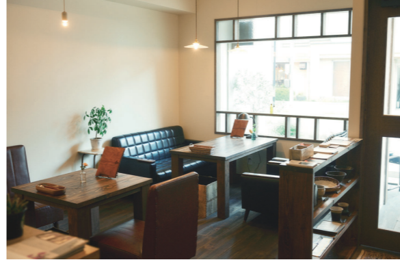
(写真上)窓際のソファ席が一番人気。柄違いの模様ガラスが配された窓からは、外からのやさしい光が降り注ぎます。