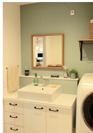
(写真上)リビングの入り口には味のあるモザイクガラスのブラケット照明を取付。奥に見える玄関には、収納量たっぷりの下駄箱をオリジナルで造作。 (写真左)アクセントでブルーグレーの壁紙を貼った、爽やかな印象のサニタリースペース。

物件データ ..... 所在地:名古屋市郊外 種別: マンション 専有面積: 80.84㎡ 施工面積: 60.00㎡ 建築年: 1995年 施工期間: 2ヶ月