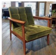
(※1) カリモク60 Kチェア (モケットグリーン)

青: 品質の良いものをメンテナンスしながら長く使うという考え方、私たちが提案しているリノベーションと通じるものがありますね。だからアネストワンのお客様にもファンが多いんだと思います。