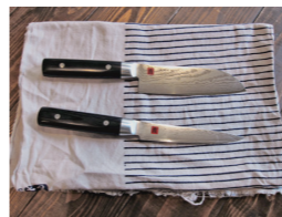
(※2) スミカマ 霞32層

林: これは岐阜県関市のスミカマというメーカーの包丁(※2)で、私も数年前から愛用しています。段々と手に馴染んできてより使いやすくなりました。品質が良いので、この包丁1本だけで何でも料理しています。