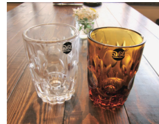
(※3) アデリア60 ルックコーラグラス

林: 実はこれ、成型過程で型を外際に出来てしまう跡なんですけど、この跡こそ手作りの証なんです。毎年秋にはお客様と岩倉市にある石塚硝子の工場へ行き、制作過程を見て頂くイベントも企画しています。商品が出来上がった様子や背景を間近に感じて頂き、愛着をもって大切に使用していきたいという思いを伝えたくて。