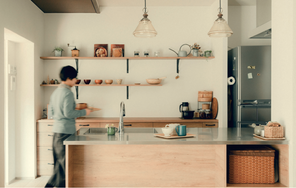
(写真上)ステンレスの清潔感と木の温もりを組み合わせたオリジナルキッチンが、スタイリッシュ過ぎず素朴な雰囲気がお気に入り。