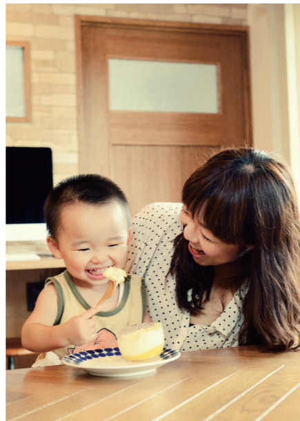
(写真上)とっても仲の良いT様ご家族。将来息さんが大きくなったら、3人でキッチンに立ち料理をするのが夢だそう。